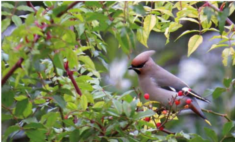
Sidensvansen gillar höstens bär.

Vad tittar Du på när Du vandrar i trädgården? Blommor såklart, träd och buskar. Naturligtvis också bäcken och dammen, men sedan då?