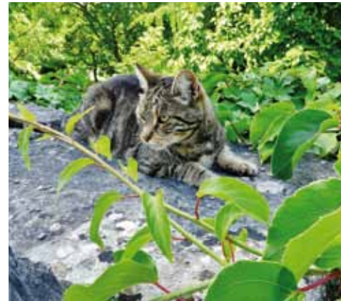
Den svart-vita katten har fångats på bild av Berit Johansson, den grårandiga är fotad av Bibi Jahr och Christina Hagvall. Tyvärr finns ingen fotograf angiven för den helgrå missen.