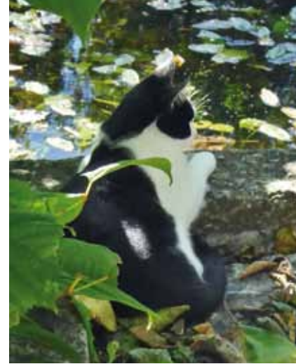
Och så har vi ju våra katter, som trivs i trädgården, i skuggan, vid dammen och bland alla människor som kommer på besök.