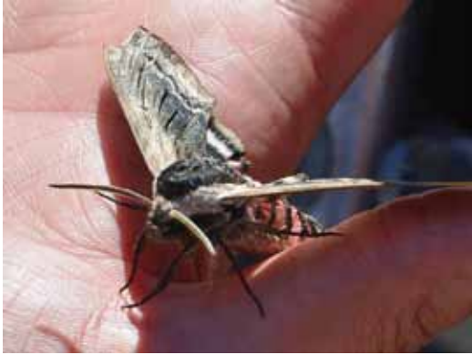
Sören Mård fick en bild på en liguster-svärmare.