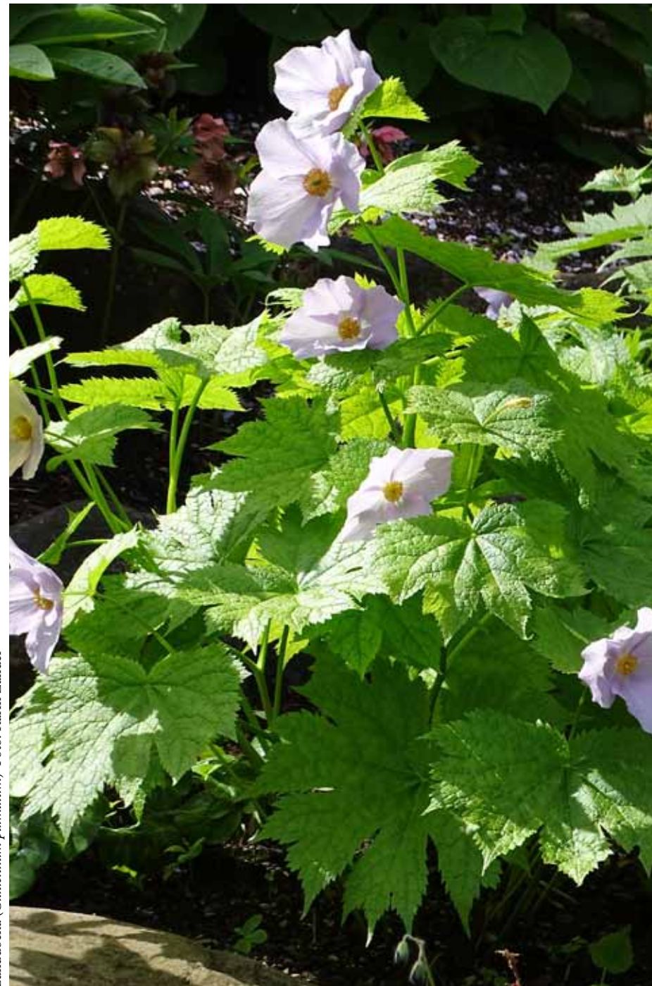
Lunddocka ( Glaukidium palmatum )