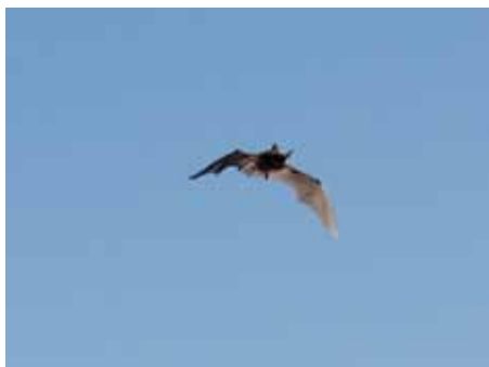
Fladdermus vid Bottarve

En fladdermus kan äta upp till 7000 myggor per natt och hjälper på så sätt till att hålla myggbeståndet på rimlig nivå.