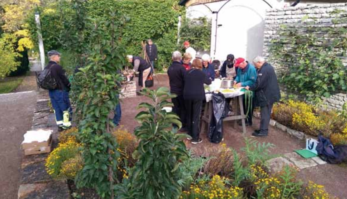
Förberedelser, grönsaker hackas, delas och finfördelas.